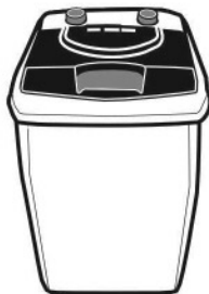
PRIME LAUNDRY AWM 452A