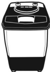
LAUNDRY AWM 453A