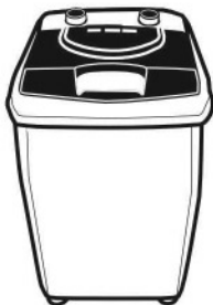
LAUNDRY AWM 451A